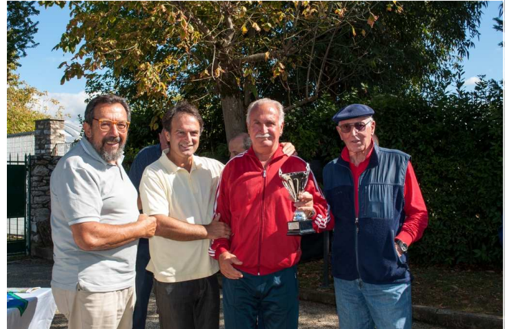
Pisa - Over 60 - 3 a class.