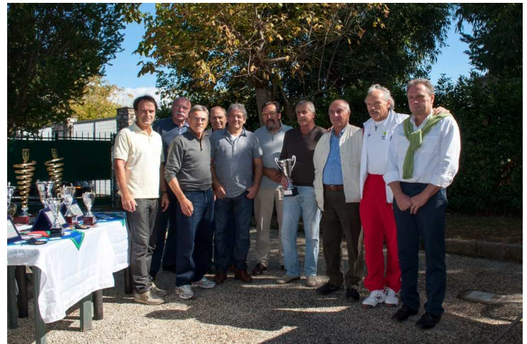
Tarvisio - Over 60 - 2 a class.