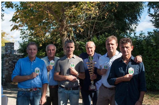
Massa - Over 50 - 1^ class.