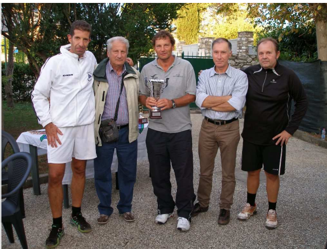
Rosignano S. - Over 40 - 2 a class.