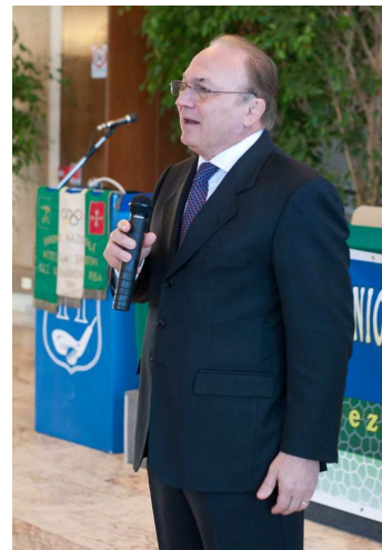
Il saluto del Prefetto Tagliente