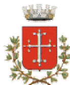
Comune di Pisa