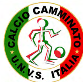
CALCIO CAMMINATO U.N.V.S. ITALIA