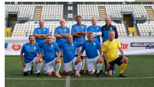
Walking Football Novara