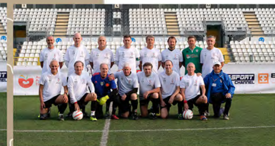
Walking Football Vercelli