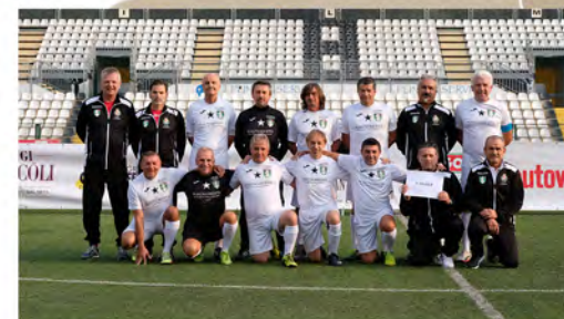
Walking Football Casale