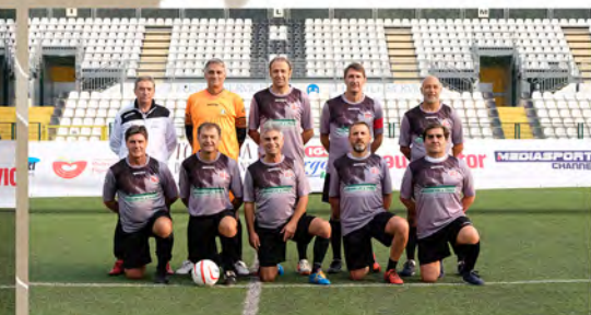
Walking Football Alessandria