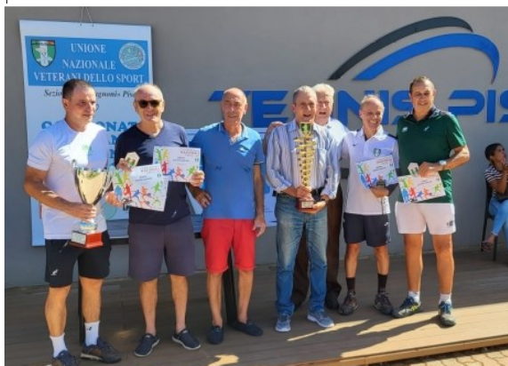
Pavia Campione Nazionale 2025