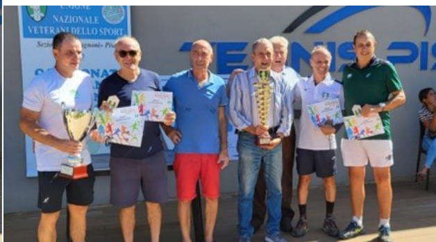
Massa 2 a classificata