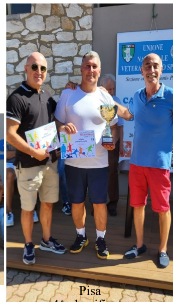
Pisa 4 a classificata