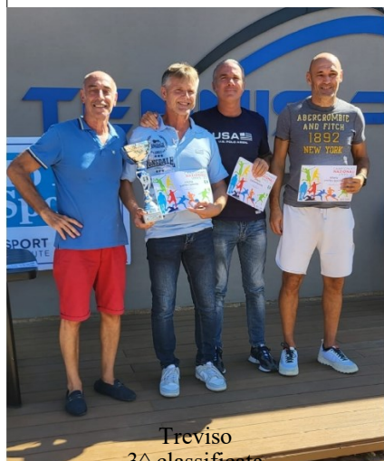
Treviso 3 a classificata