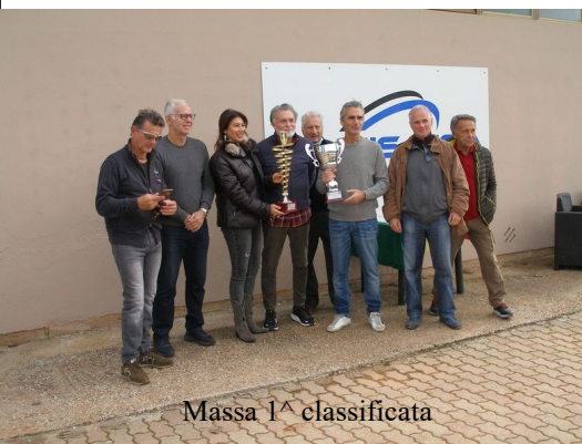
Massa 1^ classificata