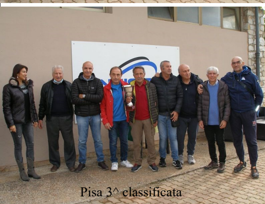
Pisa 3^ classificata