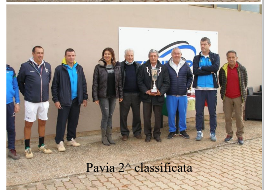
Pavia 2^ classificata