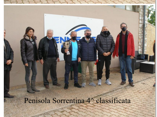
Penisola Sorrentina 4^ classificata